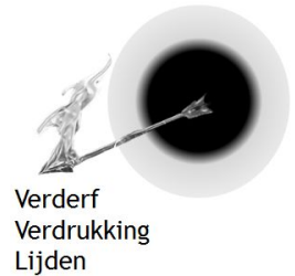
Verderf Verdrukking Lijden

Het vijfde onderdeel van onze wapenrusting is 'zaligheid'. Dit onderdeel dragen we als helm. Het woord 'zaligheid' betekent 'redding'. Het wijst ons op het feit dat wij gered zijn van de veroordeling en dus van de dood. Het is een geweldig onderdeel dat wij van God hebben ontvangen, zonder dat wij dat zelf ooit konden verdienen. Het biedt ons hoop, juist in die momenten dat het niet zo goed gaat.